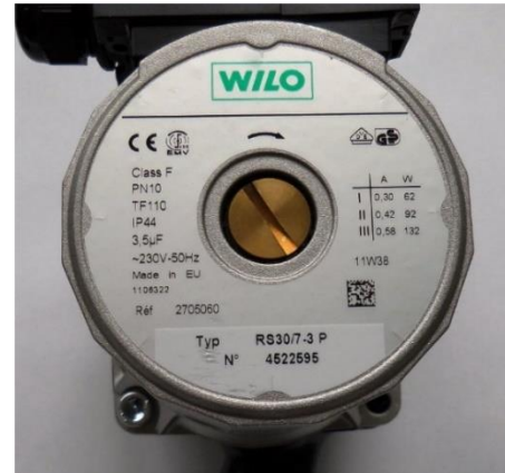
Figure 2 : Exemple de plaque signalétique pour une pompe de circulation.