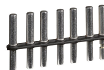
Jeu de goupilles Hager 80A No 169000053

Pour plus d'informations : Contactez le Service Comptage