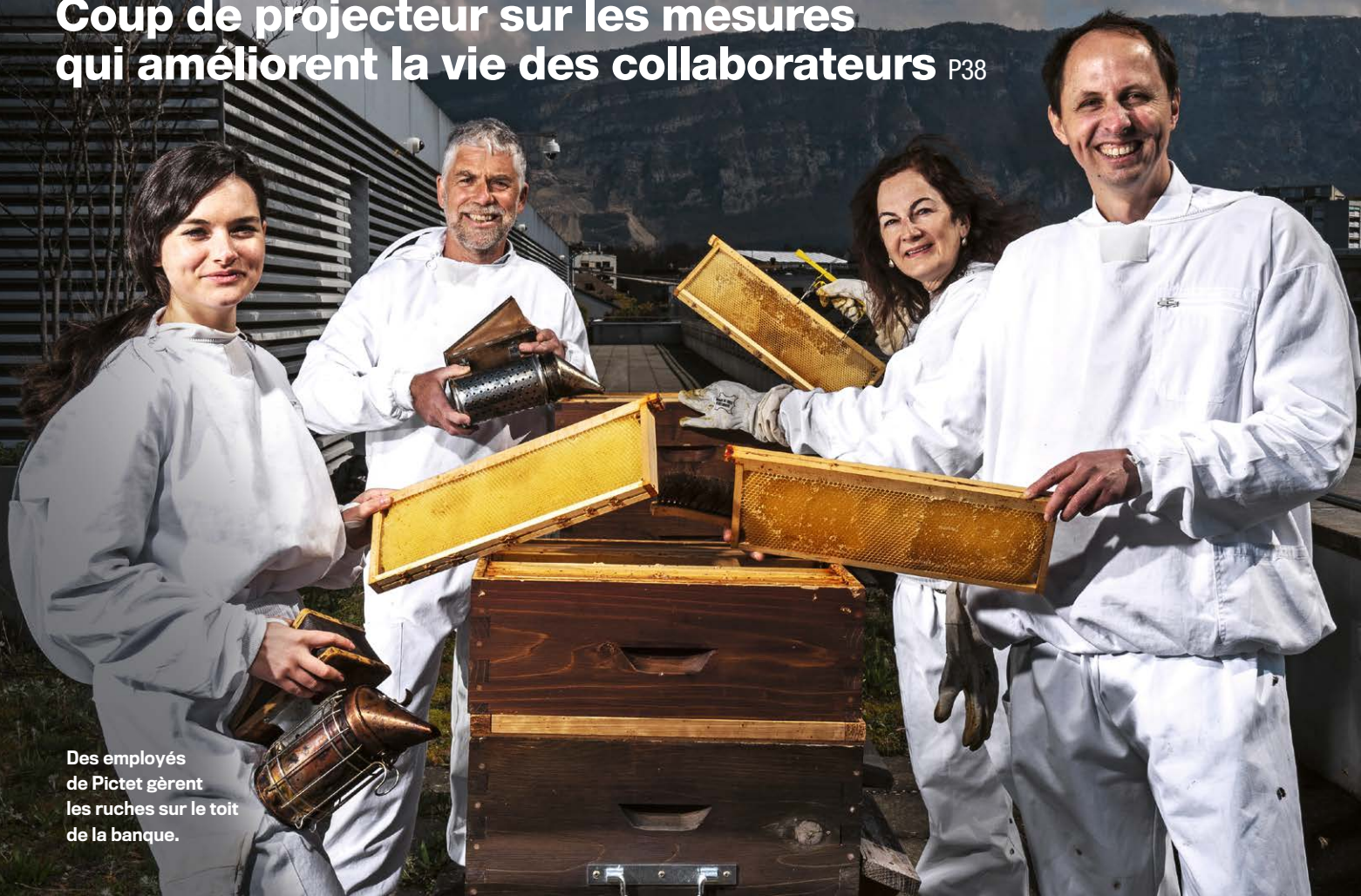
Des employés de Pictet gèrent les ruches sur le toit de la banque.

Coup de projecteur sur les mesures qui améliorent la vie des collaborateurs P38